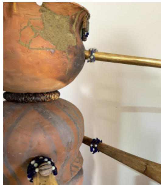
Méline Fourn, Qui dites-vous que je suis (2023)