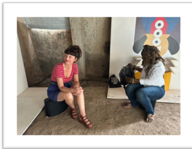
Poco&Co, Sans Origine Fixe (2023)

liens de filiation mêlant des mouvements de transmission inter et trans-générationnels ; et, les liens fraternels favorisés et renforcés par ce vivre-ensemble empreint d'anecdotes, de taquineries, d'instructions, d'initiations, de dur labeur et de moments de partage. Cette subjectivité ainsi relatée rend compte de la force de la proposition plastique de Melinda et en particulier, du travail de recherche réalisé sur l'origine du « feu ». Il s'agit là d'un processus créatif laborieux qui mêle forge, son art premier ; une mise en valeur des compétences techniques acquises au fil des expériences ; de la teinture et de la bijouterie pour plus de poésie ; de nouvelles sensations issues de la collaboration avec les artisans locaux ; et un effort physique indéniable. À l'interrogation offerte comme titre de l'œuvre, nous répondrons finalement : Vous êtes la cuisine de ma grand-mère ! Vous êtes une évocation du lieu où tout prend vie, la famille ! Vous êtes un clin d'œil au dur labeur des femmes et des hommes de la famille, du clan, de la communauté voire de la nation.