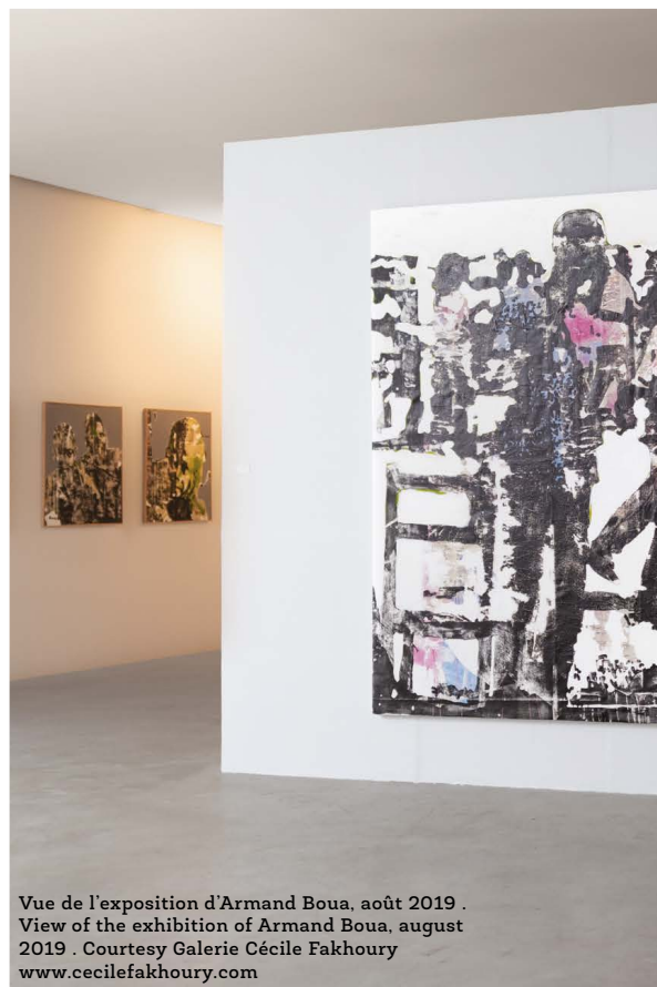
Vue de l'exposition d'Armand Boua, août 2019 . View of the exhibition of Armand Boua, august 2019 .