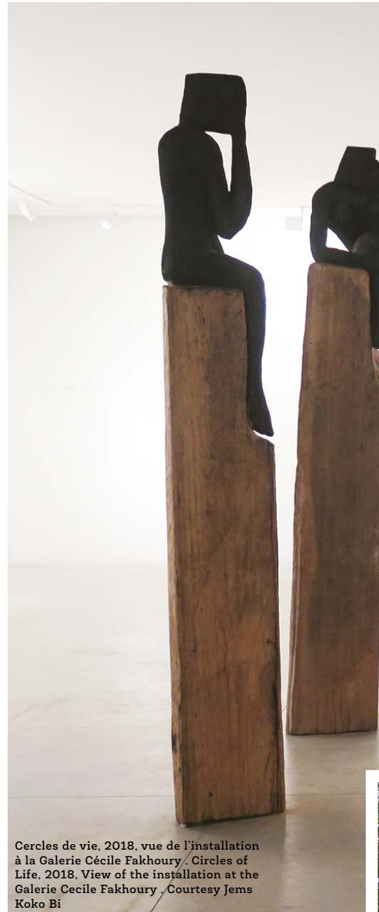
Cercles de vie, 2018, vue de l'installation à la Galerie Cécile Fakhoury. Circles of Life, 2018, View of the installation at the Galerie Cécile Fakhoury. Courtesy Jems Koko Bi

In Africa, the Beaux Arts schools are still too geared towards a European course. Yet art carries tradition, and history. It's important to encourage young people to tell their own story, the story of their culture.