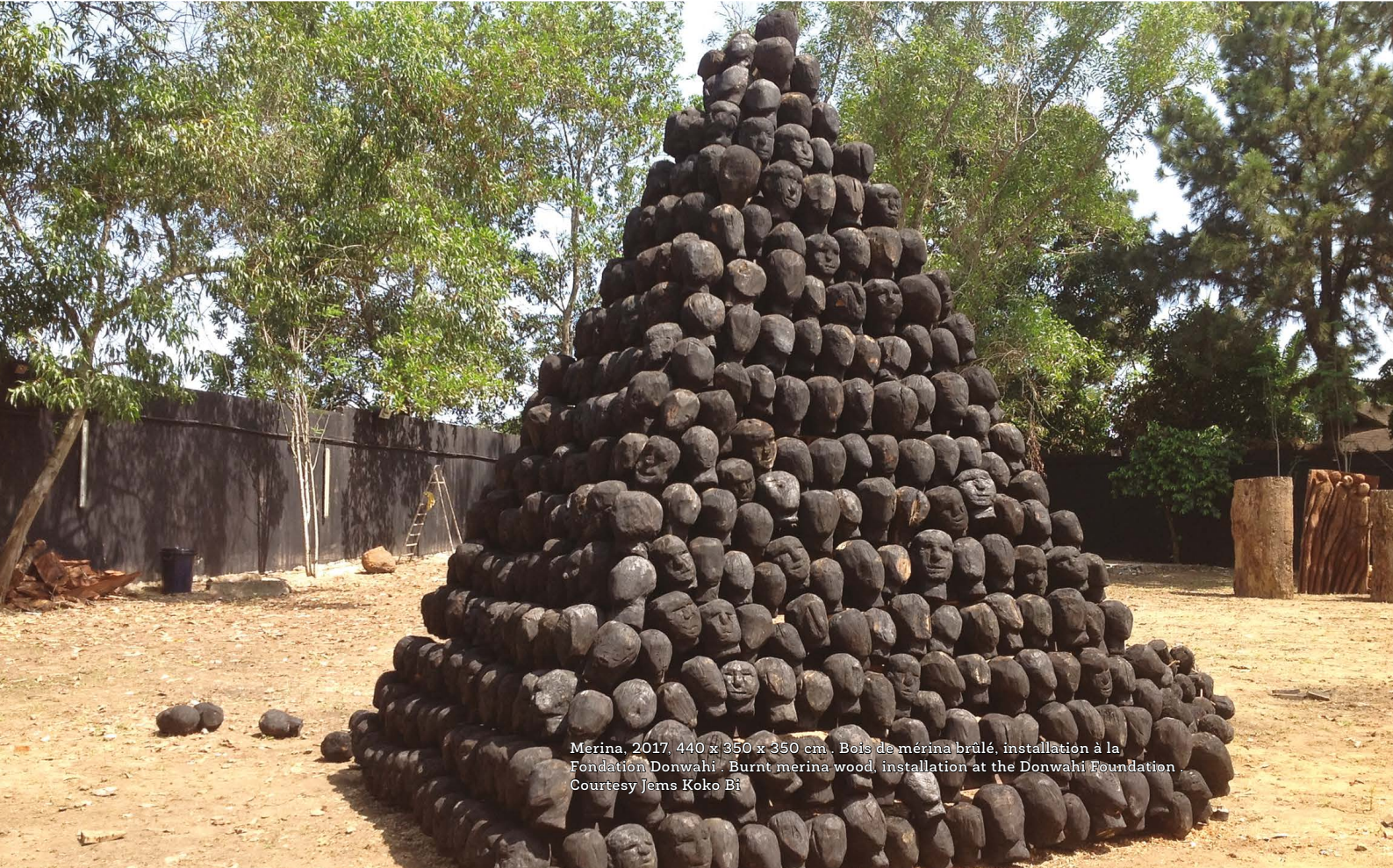
Merina, 2017, 440 x 350 x 350 cm. Bois de mérina brûlé, installation à la Fondation Donwahi. Burnt merina wood, installation at the Donwahi Foundation. Courtesy Jems Koko Bi

في أفريقيا، لا تزال مدارس الفنون الجميلة تركز بشكل كبير على المنهج الأوروبي، إلا أن الفن يحمل التقاليد والتاريخ. لذلك من المهم تشجيع الشباب على سرد قصصهم الخاصة وقصص ثقافتهم.