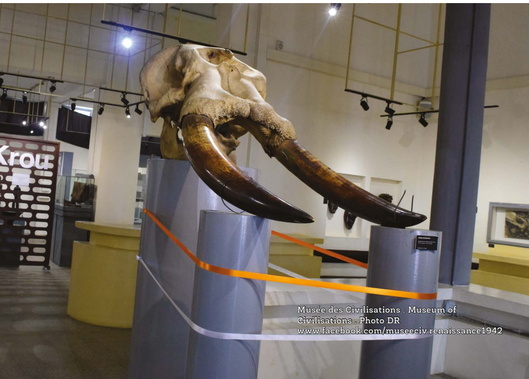
Musée des Civilisations - Museum of Civilisations - www.facebook.com/museeciv.renaissance1942