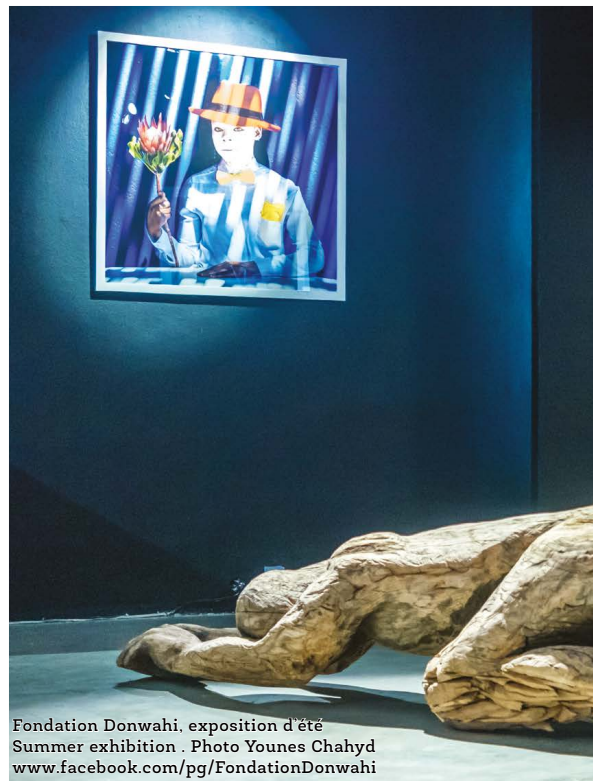
Fondation Donwahi, exposition d'été Summer exhibition . Photo Younes Chahyd www.facebook.com/pg/FondationDonwahi