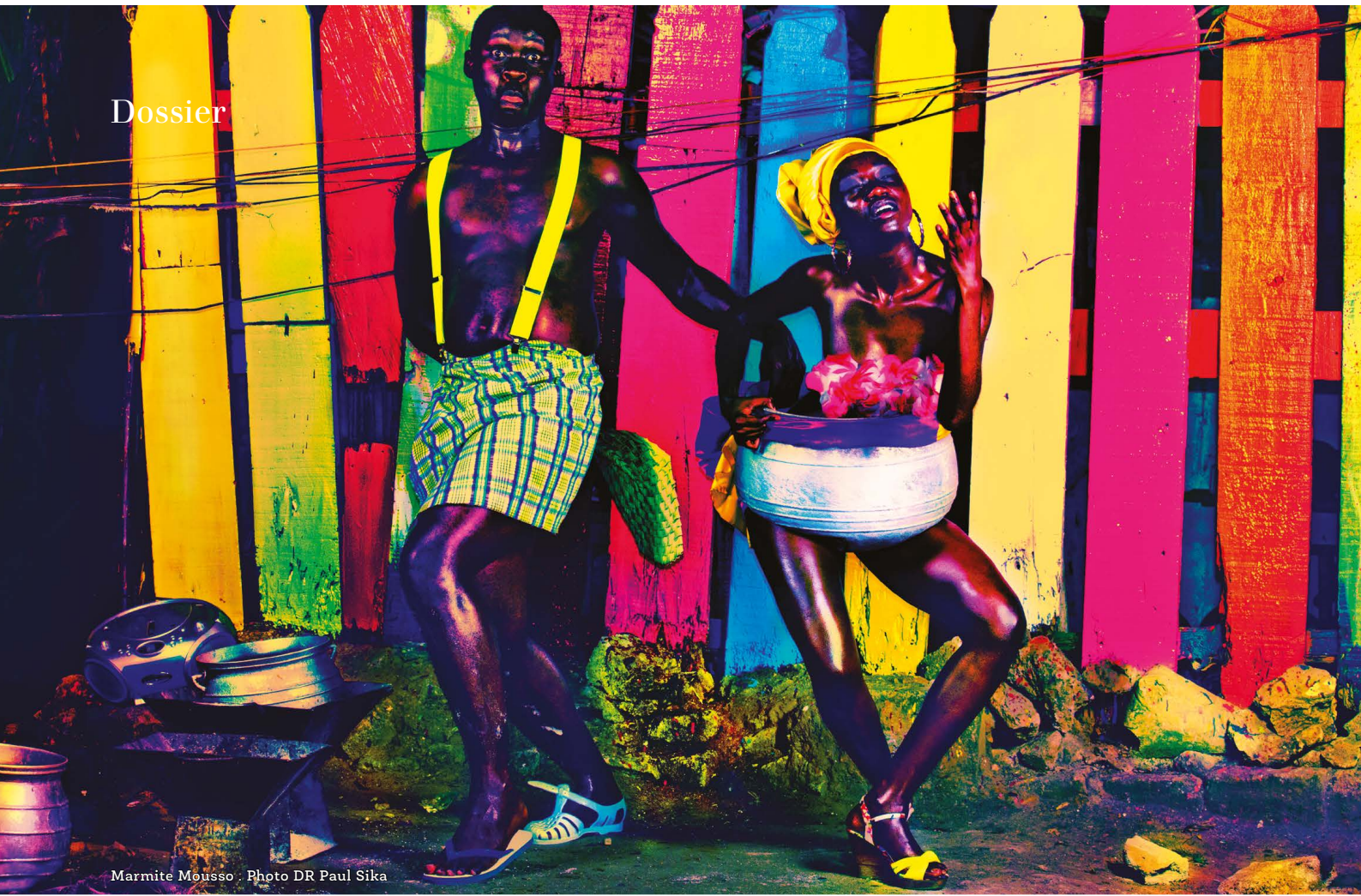
Marmite Mousso