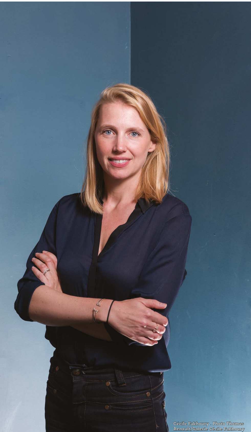
Cécile Fakhoury