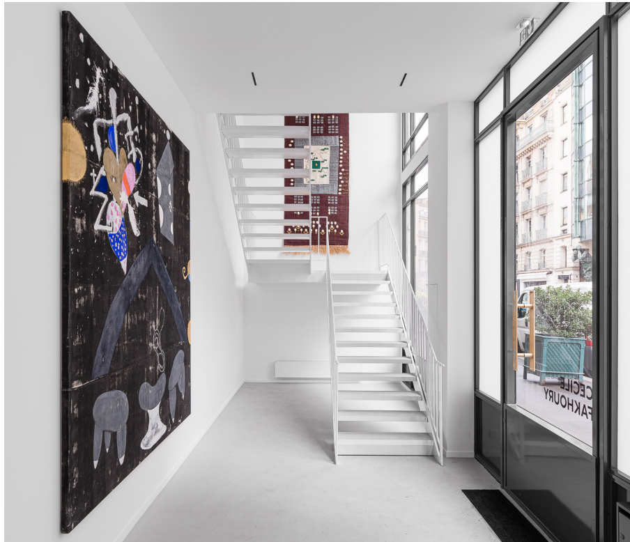
La Galerie Cécile Fakhoury à Paris