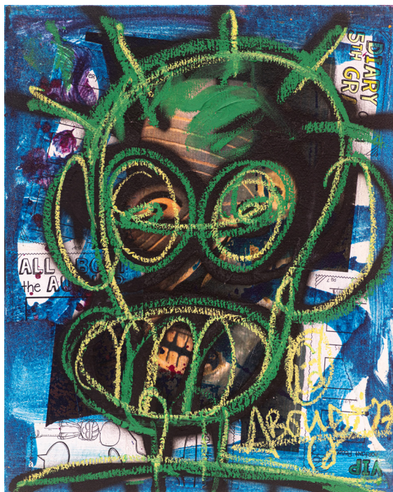
Aboudia, Môgôs Paris #3 , 2022 Technique mixte sur toile, 50 x 40 cm

Abidjan a toujours été la capitale exubérante de la joie et de l'ambiance. Dans cette série inédite résonnent les gestes saccadés du coupé-décaté ou les rythmes plus langoureux de l'afrobeat, pour nous faire vibrer au rythme de la nuit abidjanaise.