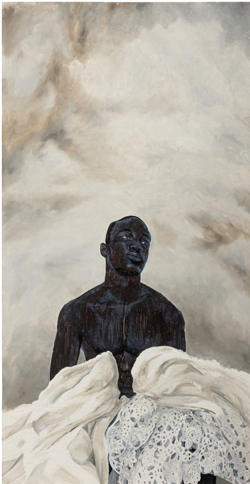
À mes yeux , 195,5 x 101,5 cm, 2022